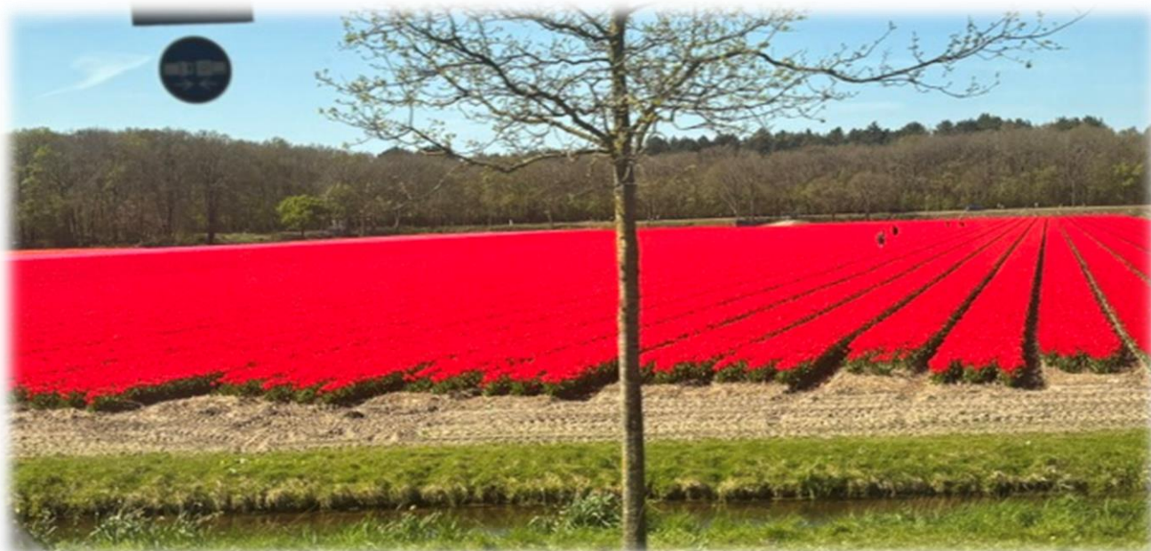
Tulpaner från Hollandsresan