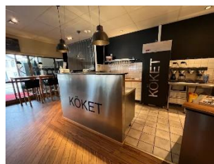
Köket i Gnosjö